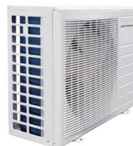
Intergas XTEND Hybride